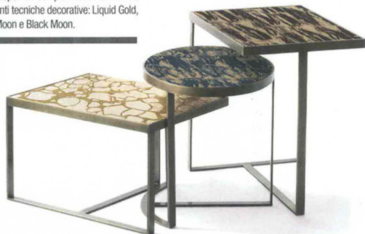
Cantori: Tavolini Venezia, disegnati da Simone Ciarmoli e Miguel Queda. Con struttura in metallo, finitura bronzo patinato, sono disponibili con piani realizzati con tre differenti tecniche decorative: Liquid Gold, Blue Moon e Black Moon.