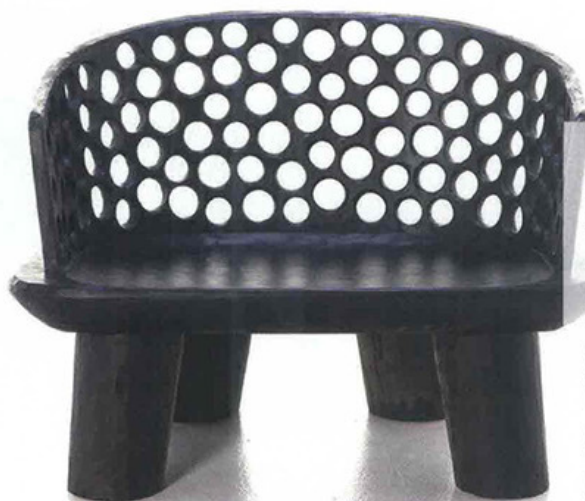
Gervasoni: Carve 07 è la nuova poltroncina bassa, in mogano intagliato a mano, della designer Paola Navone. Leggermente sagomata nella seduta, e con lo schienale semicircolare, è un "oggetto viaggiatore" che ovunque si trova porta con sé la sua storia di mondi lontani.